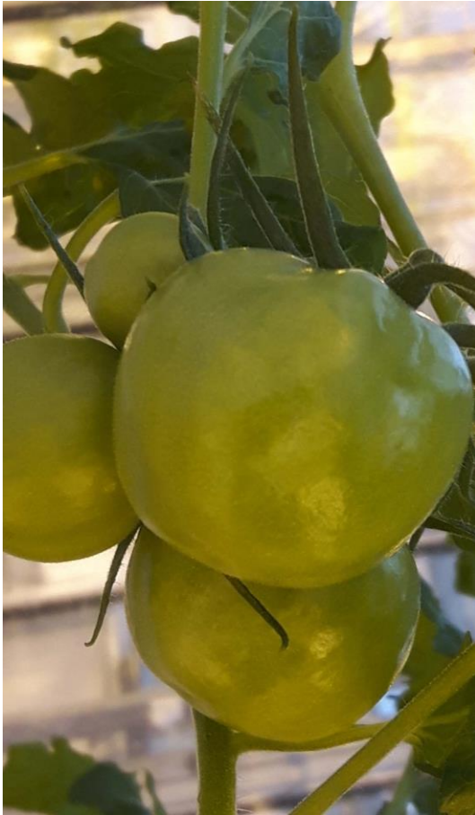
Dofheid, begin van ruwe (geribbelde) vruchten