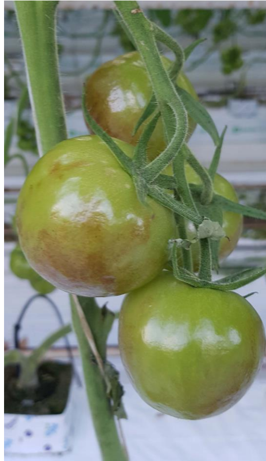
Bruine vlekken op onrijpe vruchten