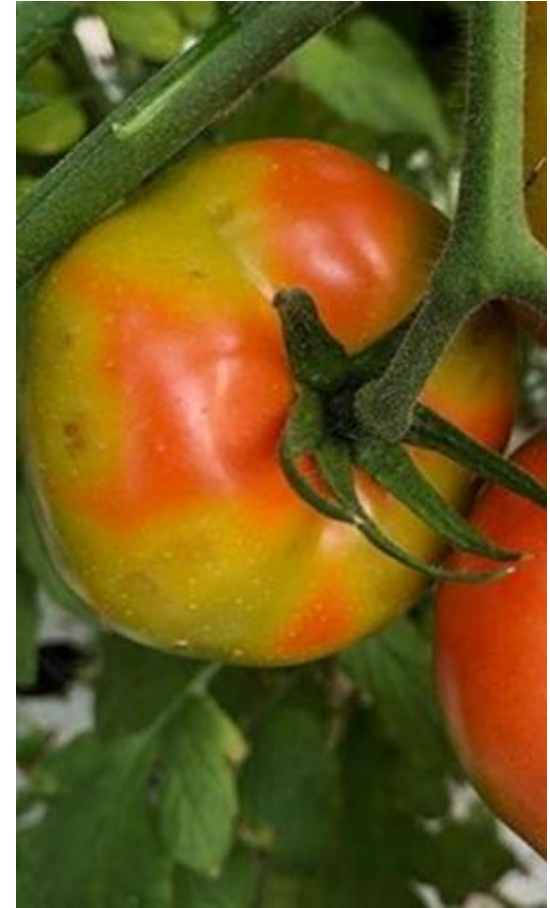
Gele vlekken op rijpe vruchten